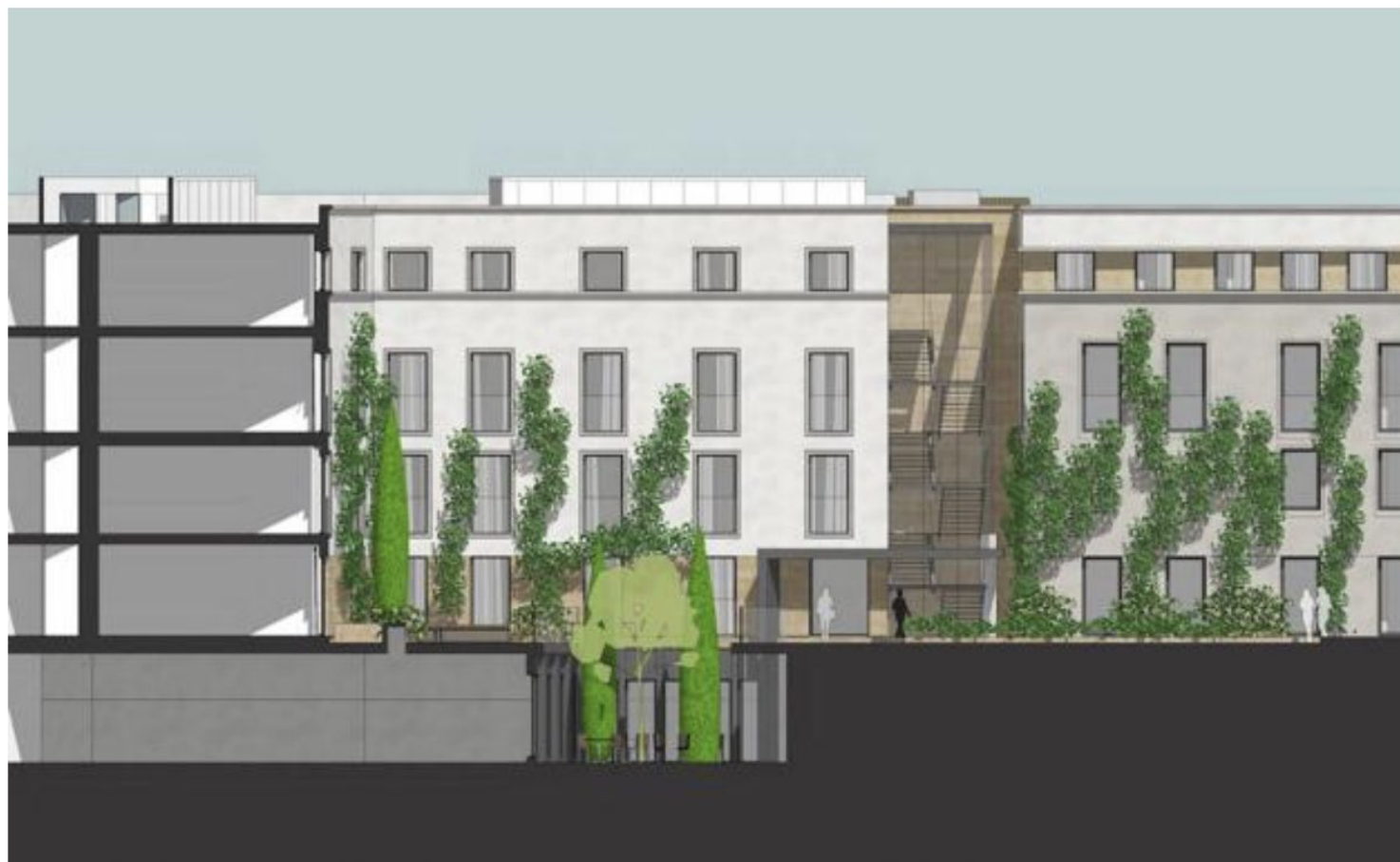
Alzado del nuevo edificio que se construirá junto al palacio

El hotel ocupará el Palacio de Godoy –un edificio renacentista del siglo XVI que aporta la Junta de Extremadura a través de Avante– y otros dos inmuebles adyacentes sin valor histórico, uno de los años setenta y otro de principios del siglo XX. Este último será demolido para construir en el solar un edificio de nueva planta como parte del hotel. Las negociaciones con los propietarios de estos inmuebles han sido largas y complejas, y de hecho ese es uno de los motivos principales del retraso que acumula el proyecto, cuya presentación en sociedad fue en diciembre de 2018.